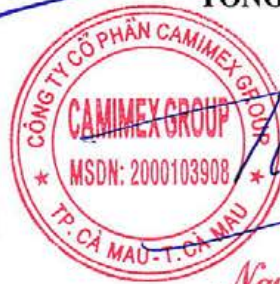
Nguyễn An Ninh